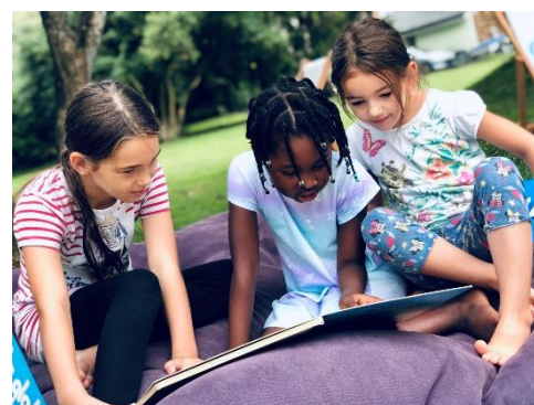
Les bains de livres, des moments de bonheur et d'évasion à ne manquer sous aucun prétexte !

Une nouvelle fois, le Bibliobus de l'Université populaire collabore étroitement avec l'Association nationale Bain de livres, pour proposer chez nous une animation particulière autour de la lecture. Le 30 août prochain en fin de journée, vous êtes tous chaleureusement conviés à cette rencontre intergénérationnelle, qui sera rehaussée de jeux divers et de musique, en plus des contes, des kamishibai (théâtre d'histoires japonais, autour d'un ouvrage de grande taille), des offres très vastes d'ouvrages à découvrir, de l'accès à des livres audios notamment.