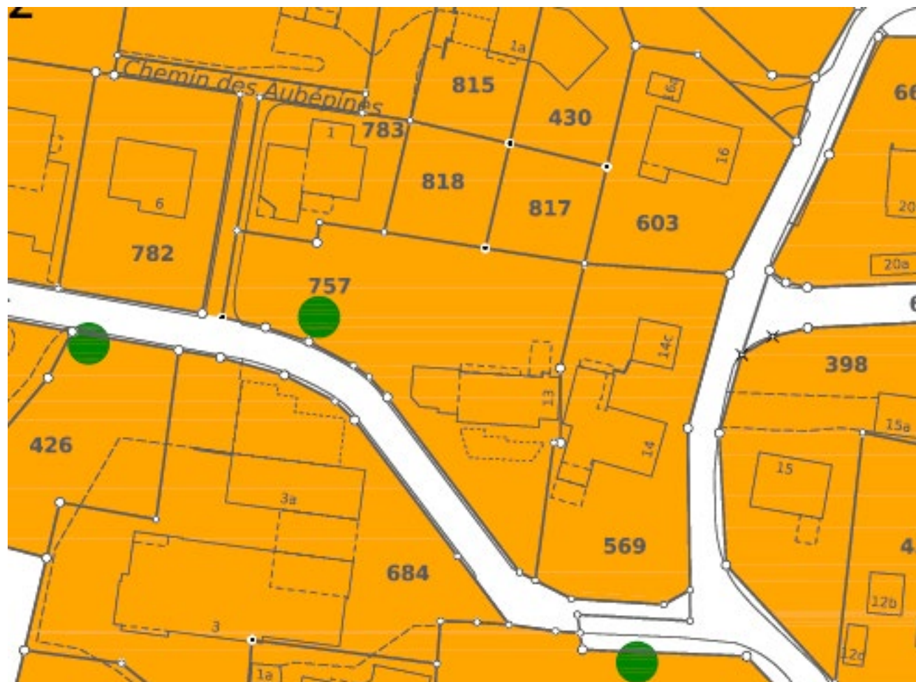
Plan à l'échelle 1 : 1000 Situation initiale / Premier dépôt public Arbre méritant protection sur la parcelle no 757

Objet : Suppression sur la parcelle no 757 de l'arbre méritant protection