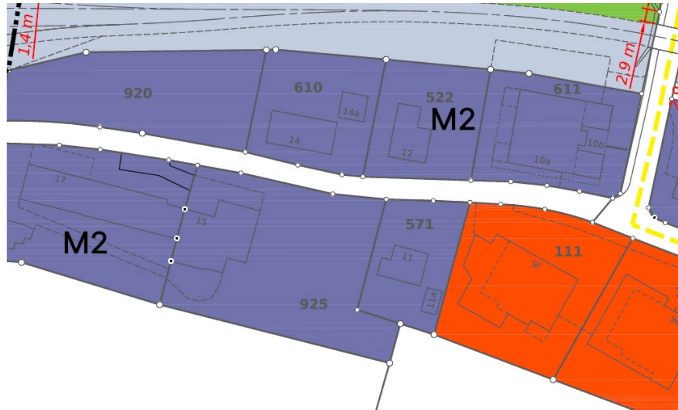
Plan à l'échelle 1 : 1000 Situation initiale / Premier dépôt public Les parcelles no 925 et 571 sont classées dans la zone M2

Objet : Transfert des parcelles no 925 et 571 de la zone M2 dans la zone M3