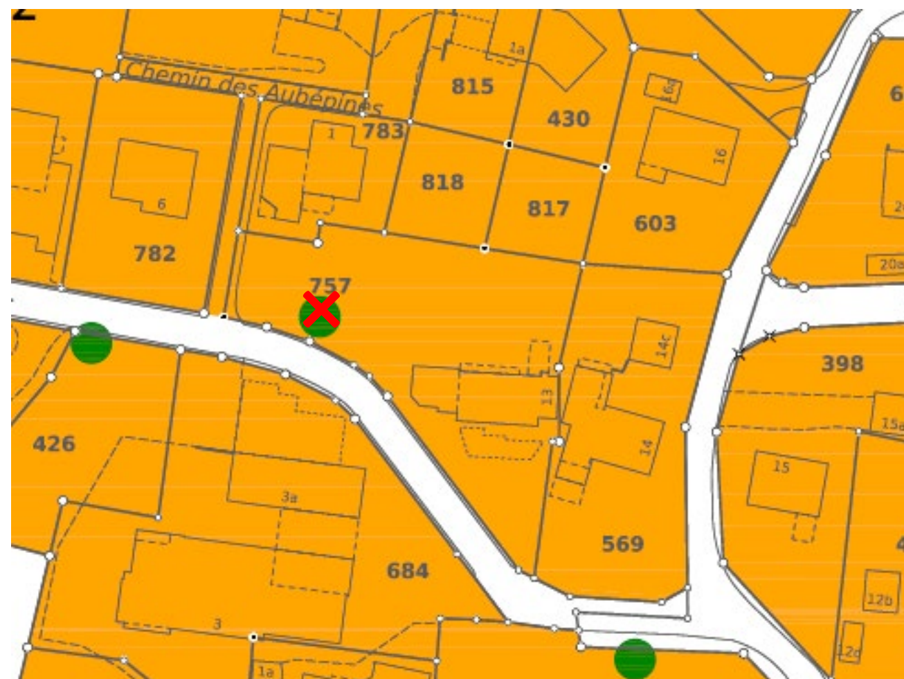
Plan à l'échelle 1 : 1000 Deuxième dépôt public Suppression sur la parcelle no 757 de l'arbre méritant protection