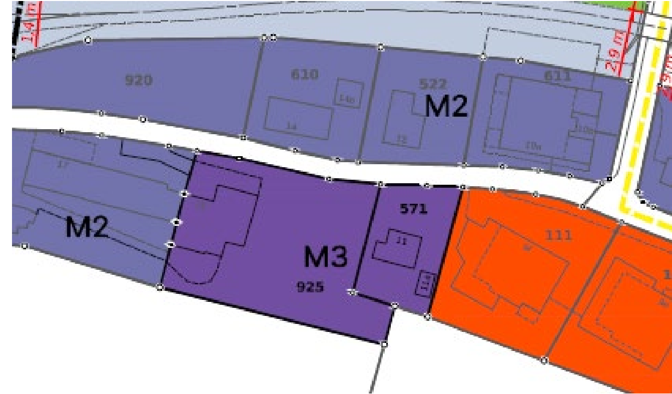
Plan à l'échelle 1 : 1000 Deuxième dépôt public Transfert des parcelles no 925 et 571 de la zone M2 dans la zone M3